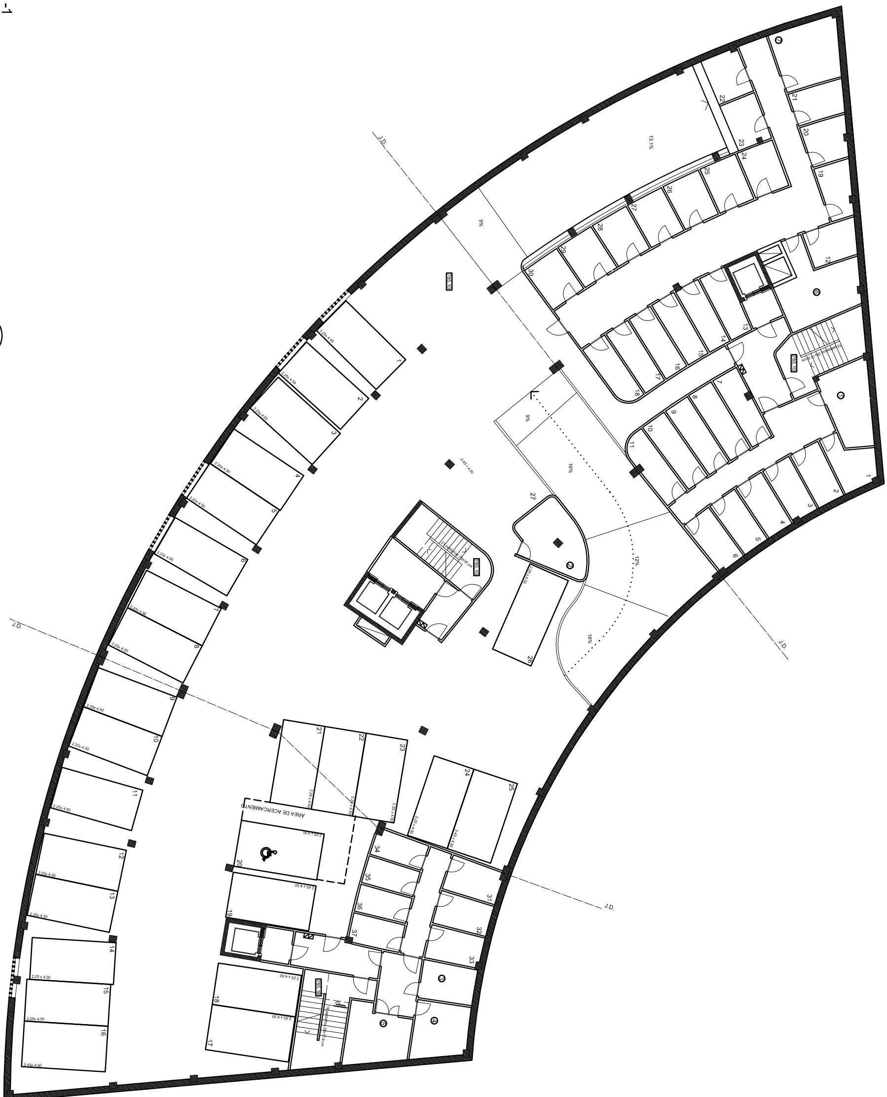
PLANTA SÓTANO -1